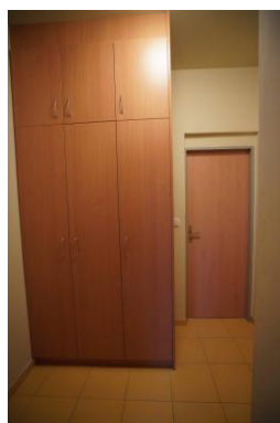
Bytová jednotka č. 6